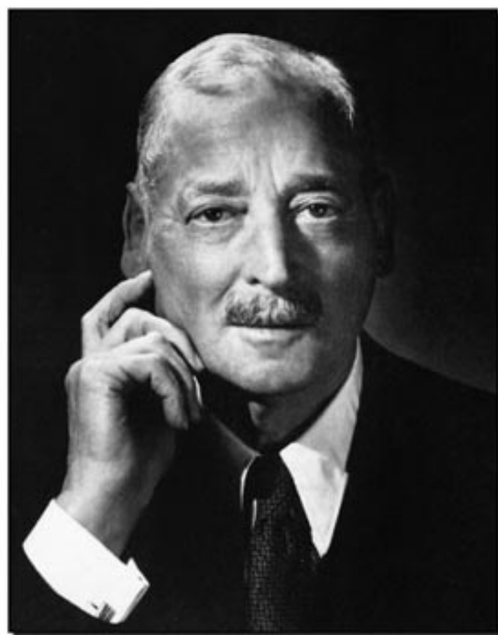
Sir Ernest Oppenheimer (1880-1957), qui contribue à renforcer, par le biais de la CSO, la situation de monopole de la De Beers dans le commerce mondial.

La filiale de la De Beers, la Central Selling Organization (CSO), compte actuellement environ 150 diamantaires agréés,