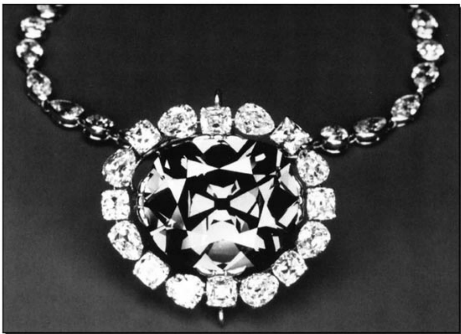
Le diamant Hope est actuellement serti dans une monture dessinée par Pierre Cartier, en 1910. Il est entouré par seize diamants, de taille poire et de taille coussin, et suspendu à une chaîne décorée de 45 diamants.

Élizabeth, épouse de George VI et mère d'Élizabeth II. Actuellement, on peut le voir à la Tour de Londres.