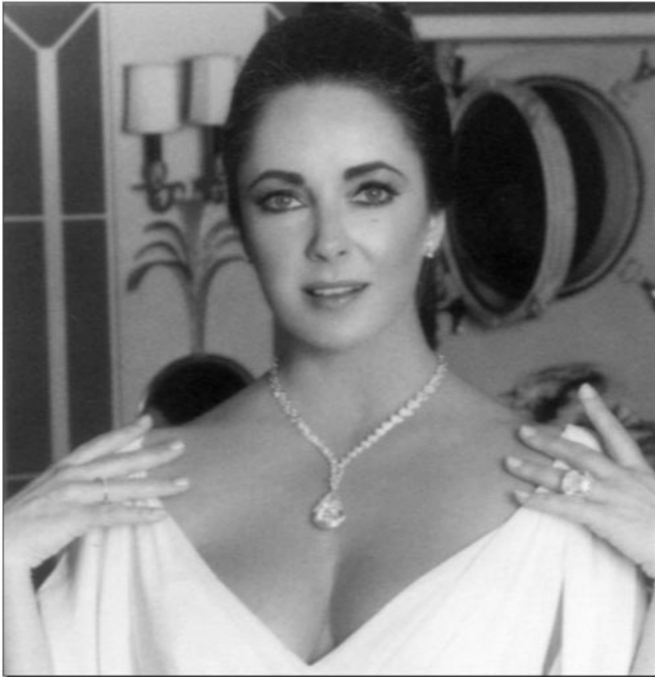
Elizabeth Taylor, lors d'une réception chez Grace de Monaco, portant ses deux plus gros diamants : le collier est décoré du diamant Taylor-Burton pesant 69,42 carats, taille poire, acheté 1 100 000 $ par Richard Burton; la bague est sertie du diamant Krupp pesant 33,19 carats, taille émeraude, acheté, en 1968, pour 305 000 $. Ce dernier tient son nom de Vera Krupp, ancienne épouse du trop célèbre marchand de canons allemand.